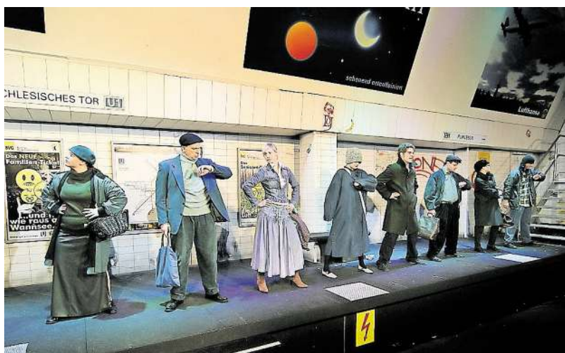
Auf dem U-Bahnhof treffen verschiedene Gesellschaftsschichten aufeinander.

Benachrichtigung in der KW 12. Begrenztes Kontingent