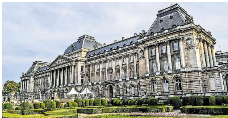
Die majestätische Parkanlage entstand im 19. Jahrhundert.

Nur wenige Tage im Jahr öffnet die belgische Königsfamilie ihre prächtigen Gewächshäuser und Gärten am Schloss von Laeken für die Öffentlichkeit. Aboplus nimmt auf vielfältigen Wunsch die seltene Gelegenheit auch in diesem Jahr wieder wahr und lädt Sie zu Tagesfahrten an verschiedenen Terminen nach Laeken und Brüssel ein. Nach der Busanreise ab Düren und Aachen beginnt der Tag mit einer kleinen Stadtrundfahrt und einem kurzen geführten Rundgang durch die historische Brüsseler Innenstadt. Wo aktuelle europäische Politik auf historische belgische Tradition trifft, gibt es viel zu entdecken. Die Reiseleitung zeigt Ihnen die schönsten und wichtigsten Sehenswürdigkeiten rund um den Grand Place. So zum Beispiel das gotische