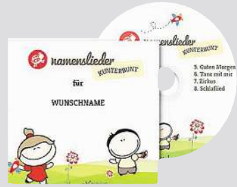
Auf dieser CD sind acht Lieder für Ihre Liebsten.

Kinderbibel: In der persönlichen Kinderbibel erzählt Jesus eindrucksvoll dem Kind aus seinem Leben. Mit Gleichnissen gibt er der Hauptperson nützliche Hinweise für den Umgang mit seinen Mitmenschen. Mit der persönlichen Widmung auf der ersten Seite erfüllt das Buch den Wunsch des Schenkenden nach einer einzigartigen Gabe – beispielsweise zur Kommunion. Die Texte sind kind- bzw. jugendgerecht (Altersempfehlung: 4-15 Jahre) und besonders fantasievoll illustriert. Aboplus-Preis: 18,80 € (inkl. Versandgebühr). Bestellung online unter: www.verlagbuch.de/aboplus